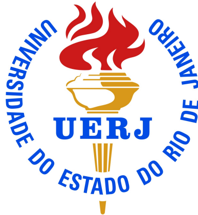
Figure 2 - Legenda da figura.