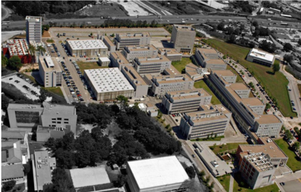
Figura 2.1: Fotografia aérea do Campus da FEUP.

Onde a é o coeficiente de 2º grau; b o de 1º grau; c o coeficiente independente da variável x , a determinar. As equações devem ser referidas mantendo o seu número. Por exemplo, a Equação 2.2 resolve problemas formulados tal como mostrado na Equação 2.1.