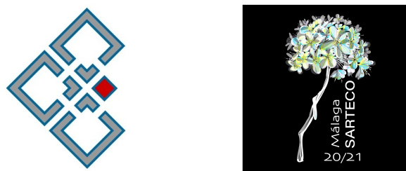
(a) Logo Sarteco

Si quieres poner varias sub-figuras dentro de una misma figura, puedes usar el paquete subfig , como en la Fig.2 (incluye Figs. 2a y 2b).