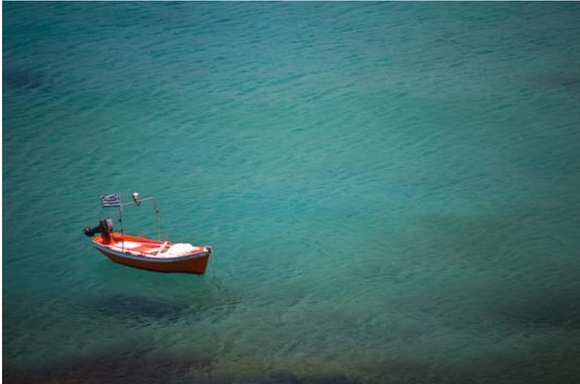
Slika 1.1: Primer slike

in reprehenderit in voluptate velit esse cillum dolore eu fugiat nulla pariatur. Excepteur sint occaecat cupidatat non proident, sunt in culpa qui officia deserunt mollit anim id est laborum.