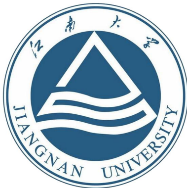
Figure 1: 学校 logo