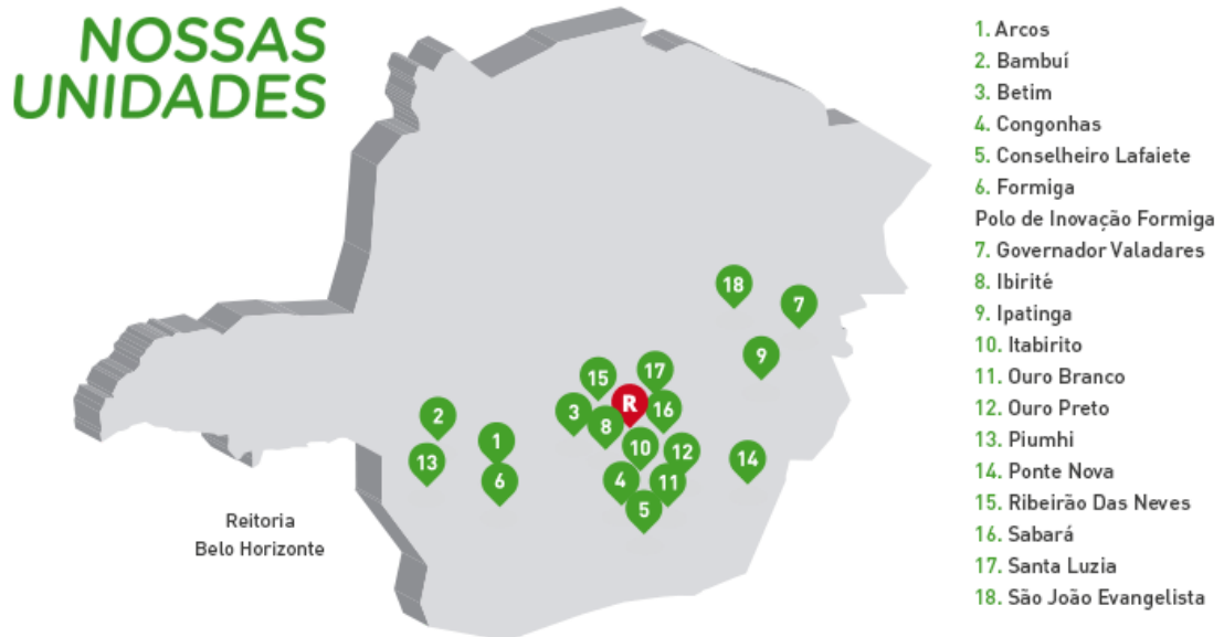
Figura 4 – Mapa de unidades do IFMG.